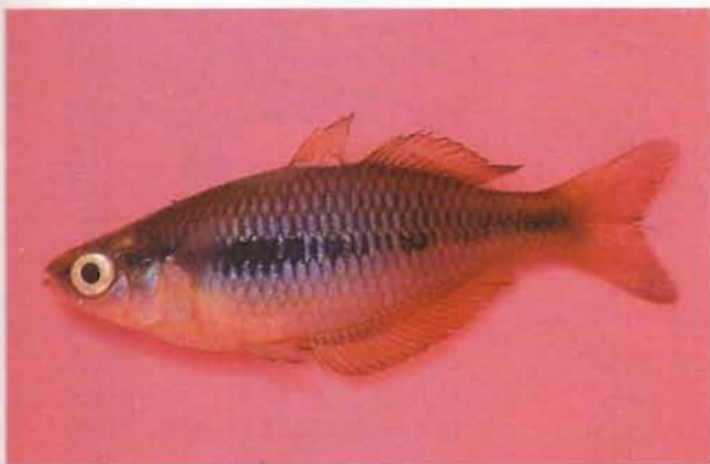
Fig. 9. - Melanotaenia parva , mâle holotype, 40,0 mm LS. Melanotaenia parva , male holotype, 40.0 mm SL.

M. irianjaya est largement réparti sur Vogelkop Peninsula (fig. 12) et se trouve aussi immédiatement au sud sur Bomberai Peninsula.