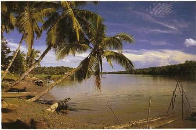
Fig. 1. - Bintuni River à Bintuni Village, camp de base de l'expédition de 1989 à Vogelkop Péninsule. Les petits affluents de cette rivière sont habités par Melanotaenia irianjaya .

The Bintuni River at Bintuni Village, base camp for the 1989 expedition to the Vogelkop Peninsula. Small tributaries of this river are inhabited by Melanotaenia irianjaya .