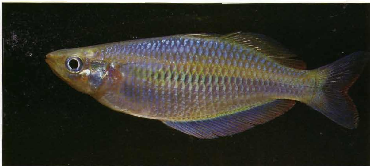
Fig. 7. - Melanotaenia fredericki , mâle, 84,5 mm LS, photographié vivant. Melanotaenia fredericki , male, 84.5 mm SL, photographed alive.

36 à 38 ; écailles prédorsales 15 à 18 ; écailles préopercule-sousorbitaire 11 à 15. Dimensions relatives en pourcentage de LS : plus grande hauteur du corps (adultes à 50 mm LS) : mâles : 35,9-36,1 ; femelles 30,6-35,0 ; longueur de la tête 26,5-28,2 ; longueur du museau 7,9-9,8 ; diamètre de l'oeil 7,1-8,8 ; largeur interorbitaire 9,3-10,2 ; hauteur du pédoncule caudal 10,2-12,6 ; longueur du pédoncule caudal 12,7-15,5 ; longueur prédorsale 50,4-52,4 ; longueur préanale 47,9-51,7 ; la première nageoire dorsale prend naissance en face de la base du 4 e au 6 e rayon mou de la nageoire anale.