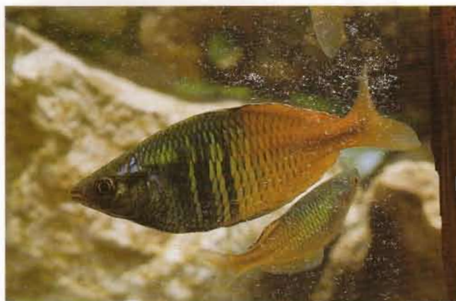
Fig. 6. - Melanotaenia boesemani , mâle, environ 80 mm LS. Melanotaenia boesemani , male, about 80 mm SL.

Rayons de la dorsale IV à VI-I, 10 à 14 ; rayons de l'anale I, 17 à 23 ; rayons de la pectorale 13 à 16 ; rangées horizontales d'écaillles 7 ou 8 ; rangées verticales d'écaillles 32 à 37 ; écaillles prédorsales 14 à 16 ; écaillles préopercule-sousorbitaire 7 à 15. Dimensions relatives en pourcentage de LS : plus grande hauteur du corps (adultes 50 mm LS : mâles : 35,6-44,5 ; femelles 33,6-39,4 ; longueur de la tête 26,4-31,1 ; longueur du museau 6,7-9,1 ; diamètre de l'oeil 7,1-10,2 ; largeur interorbitaire 8,0-11,9 ; hauteur du pédoncule caudal 10,2-13,7 ; longueur du pédoncule caudal 12,8-18,1 ; distance prédorsale 49,2-56,1 ; distance préanale 50,7-58,6.