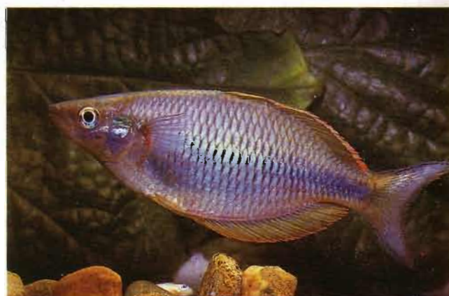
Fig. 8. - Melanotaenia irianjaya , 80 mm LS, d'un ruisseau près de Bintuni, photographié vivant. Melanotaenia irianjaya , 80 mm SL, from creek near Bintuni, photographed alive.

61 spécimens, 18,0-90,0 mm LS : ANSP 68521 (holotype), 28,0 mm LS ; ANSP 68522-68525 (paratypes), 4 spécimens, 22,0-28,0 mm LS ; MZB non inventorié, 23 spécimens, 37,0-81,0 mm LS, petit ruisseau à environ 14 km au sud de Sorong ; WAM P.29981-001, 33 spécimens, 18,0-90,0 mm LS, récoltés avec les spécimens MZB.