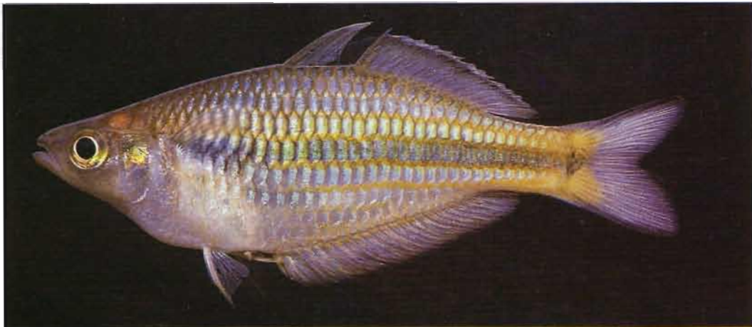
Fig. 4. - Melanotaenia arfakensis , mâle paratype (WAM P.29950-001), 57,0 mm LS. Melanotaenia arfakensis , male paratype (WAM P. 29950-001), 57.0 mm SL.