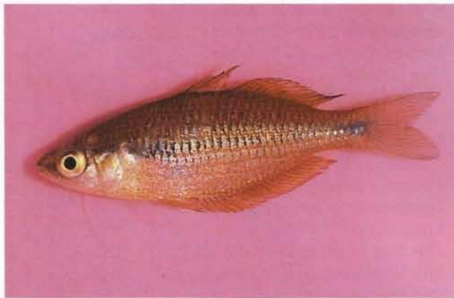
Fig. 10. - Melanotaenia parva , mâle paratype (WAM P.29970-001), 41,0 mm LS. Melanotaenia parva , male paratype (WAM P.29970-001), 41.0 mm SL.

234 spécimens, 13,0-80,5 mm LS : MZB 4952 (holotype), 50,0 mm LS, Fruata ; MZB 4953 (paratypes), 50 spécimens, 20,0-58,0 mm LS, Fruata ; MZB 4954 (paratypes), 9 spécimens, 34,8-58,8 mm LS, Merdai ; RMNH 29398 (paratypes), 5 spécimens, 28,4-45,2 mm LS, Merdai ; WAM P.27862-001 (paratypes), 12 spécimens, 29,5-50,5 mm LS, Fruata ; WAM P. 27864-001 (paratypes), 32 spécimens, 21,0-55,0 mm LS, Merdai ; WAM P.27868-001 (paratypes), 41 spécimens, 13,0-53,0 LS, Suswa ; WAM P.27869-001 (paratypes), 17 spécimens, 14,0-47,0 mm LS, Senopi ; WAM P.29955-001, 10 spécimens, 19,0-60,0 mm LS, Bintuni ; WAM P.29960-001, 53 spécimens, 32,0-80,5 mm LS, Bintuni ; ZMA 119.213 (paratypes), 4 spécimens, 36,2-50,5 mm LS, Merdai.