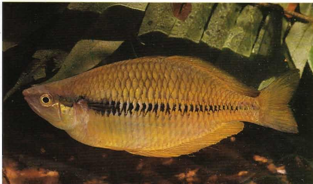
Fig. 3. - Melanotaenia angfa , mâle holotype, 109,3 mm LS, photographié vivant. Melanotaenia angfa , male holotype, 109.3 mm SL, photographed alive.