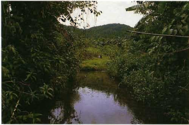
Fig. 5. - La localité typique de Melanotaenia arfakensis près de Manokwari, Irian Jaya. The type locality of Melanotaenia arfakensis near Manokwari, Irian Jaya.

Écailles relativement grandes, disposées en rangées horizontales régulières ; la plupart des écailles du corps avec des bords dentelés ; écailles prédorsales atteignant la portion postérieure de l'interorbitaire ; 3 rangs d'écailles entre l'angle postérieur du préopercule et le bord de l'œil.